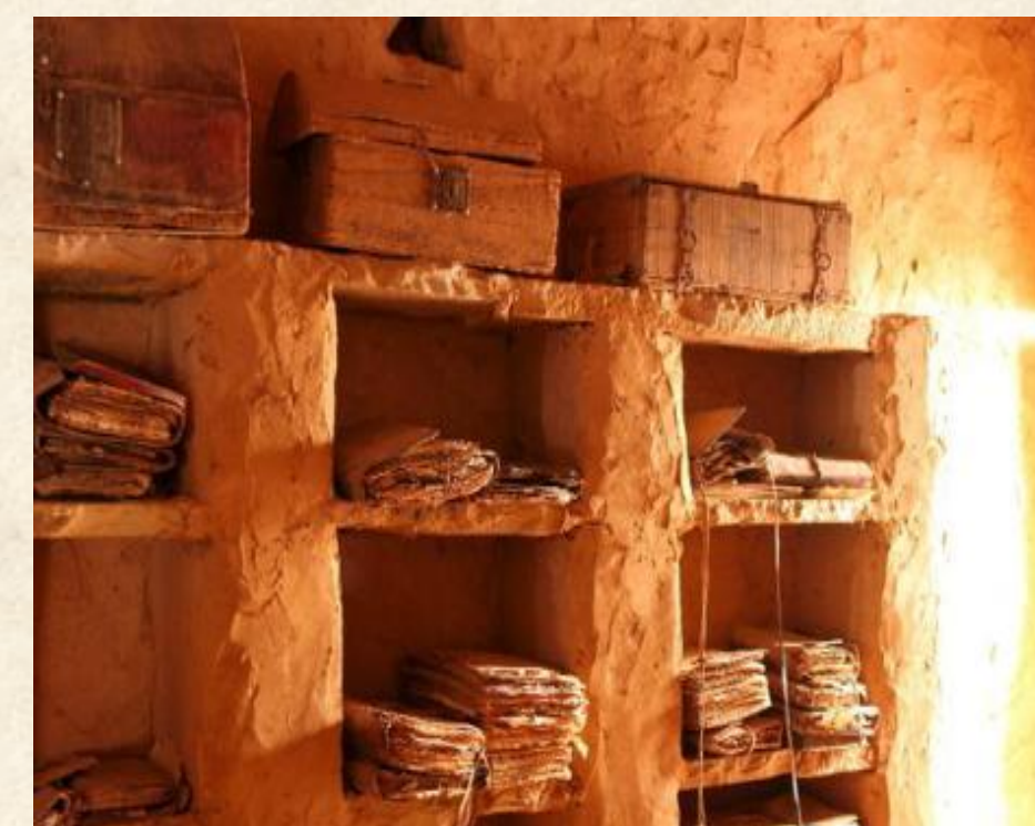
Antigua biblioteca árabe