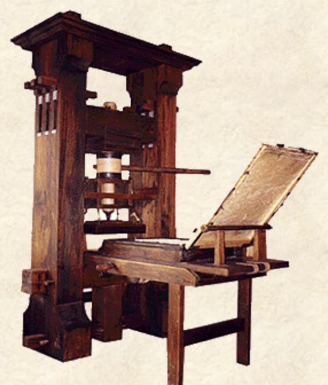
Imprenta de Gutenberg